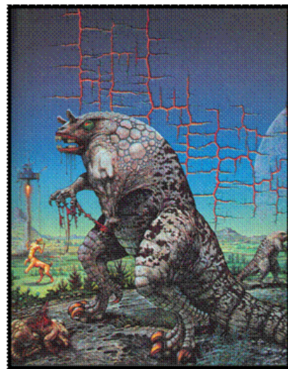
ลักษณะผิวในธรรมชาติและลักษณะผิวในงานทัศนศิลป์