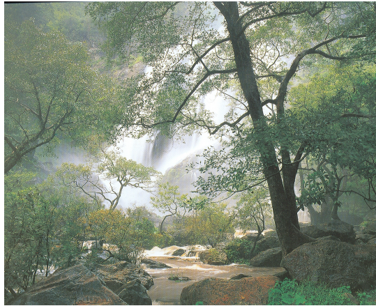
น้ำตกคลองลาน อุทยานแห่งชาติคลองลาน อำเภอคลองลาน จังหวัดกำแพงเพชร

ธรรมชาติอันงดงามจะถ่ายทอดเป็นงานศิลปะได้อย่างไร