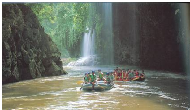
ภาพนักท่องเที่ยวกำลังล่องแก่งล่อเร อำเภออุ้มผาง จังหวัดตาก ซึ่งเป็นแหล่งท่องเที่ยวทางธรรมชาติที่มีมนต์ขลังอีกแห่งหนึ่งของไทยเรา

ความงดงามอันน่าประทับใจของธรรมชาตินี้ ทำให้เกิดคำถามที่น่าคิดว่าความงามของธรรมชาติเป็นศิลปะ หรือไม่ และธรรมชาติกับศิลปะเกี่ยวข้องกันอย่างไร