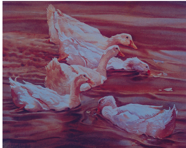
ความสัมพันธ์กัน สอดคล้องกัน

เราจะออกแบบงานทัศนศิลป์ให้มีความสัมพันธ์กลมกลืนได้อย่างไร