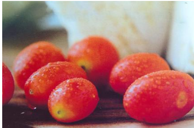
ความกลมกลืนด้วยสี

การเลือกใช้สีในวรรณคดีเดียวกัน จะทำให้สีกลมกลืนกันได้