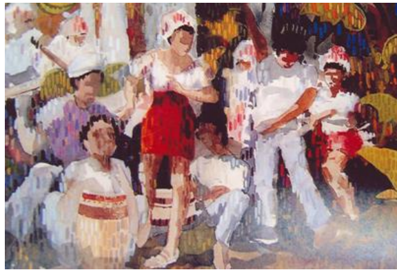
ความกลมกลืนด้วยลักษณะผิว