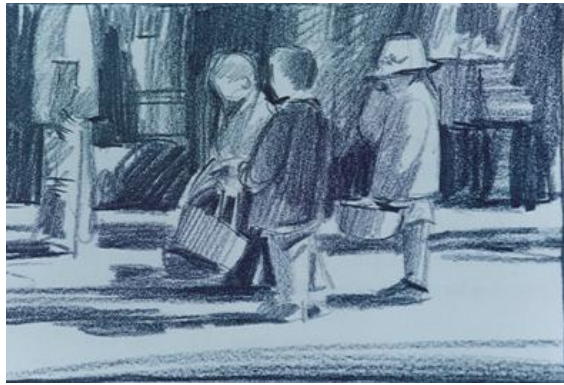
ความกลมกลืนด้วยเส้น

การใช้เส้นในลักษณะเดียวกัน หรือในทิศทางเดียวกันมาจัดรวมกัน จะทำให้เกิดความกลมกลืนกันได้