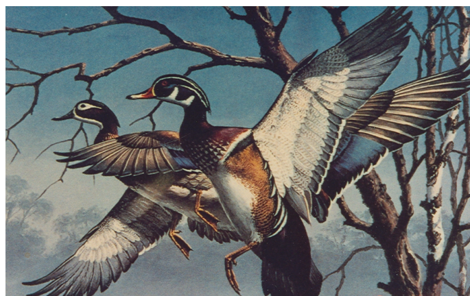
ความกลมกลืนจากสิ่งที่เหมือนกัน

ความกลมกลืนในการจัดองค์ประกอบศิลป์ด้วยรูปร่างหรือรูปทรงที่เหมือนกันมีลักษณะซ้ำๆ กัน