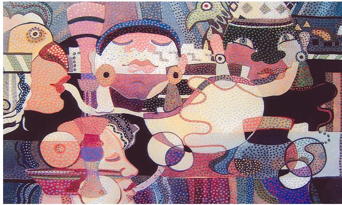
ความกลมกลืนจากสิ่งที่คล้ายกัน

รูปร่าง รูปทรง หรือสิ่งที่มีลักษณะใกล้เคียงกัน เช่น การใช้รูปทรงกลมและวงรีมาจัดเข้ากลุ่มกัน จะเกิดความกลมกลืนกันได้ เป็นต้น