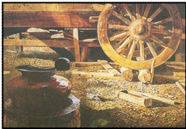
“สินกระเสกรรม” ภาพวาดสีน้ำ ผลงานของเกียรติศักดิ์ ผลิตาภรณ์

ความขัดแย้ง หมายถึง ความไม่ประสานกลมกลืนหรือความไม่เท่ากัน ซึ่งควรมีไม่เกิน 20% ของภาพจะทำให้ภาพแลดูมีเสน่ห์ และเร้าใจ