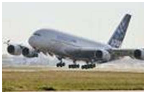
เครื่องบินขึ้นลงบริเวณท่าอากาศยานก่อให้เกิดมลภาวะทางเสียง

มลภาวะทางเสียง (Sound pollution) หมายถึง สภาพแวดล้อมที่มีเสียงดังเกินกว่าสภาวะปกติ และมีความต่อเนื่องยาวนาน ซึ่งจะมีผลกระทบต่อประสาทการรับรู้ทางหู จากระดับไม่รุนแรง สร้างความเคียดแค้นรำคาญ มีผลกระทบต่อเด็ก ผู้สูงอายุ ผู้ป่วย จนถึงขั้นสูญเสียการได้ยิน นับว่ามีผลเสียต่อสภาพจิตใจและร่างกายเป็นอย่างยิ่ง สาเหตุของมลภาวะทางเสียงเกิดจากการใช้พลังงานของเครื่องจักรกล เช่น เสียงเครื่องบินขึ้นลง บริเวณท่าอากาศยาน เสียงการเร่งเครื่องยนต์ของรถจักรยานยนต์ รถยนต์ และเรือยนต์ โดยเฉพาะเครื่องยนต์ที่มีการตกแต่งตัดแปลงเสียง เครื่องจักรโรงงาน อุตสาหกรรม เป็นต้น