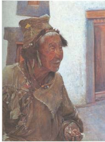
ภาพโปสเตอร์ที่สะท้อนลักษณะผิว ให้ความรู้สึกตื่นตัว ที่ชัดเจน

ลักษณะผิว เป็นพื้นผิวของโปสเตอร์ที่สามารถมองเห็นและสัมผัสได้ เช่น ผิวเรียบ ผิวมัน ผิวหยาบ ผิวเป็นลายเส้น เป็นต้น ลักษณะผิวนี้อาจจะดูได้จากประเภทของกระดาษ หรือภาพในโปสเตอร์ที่แสดงพื้นผิวให้ผู้ดูมองหรือสัมผัสแล้วให้ความรู้สึกที่ดี เช่น ผิวหยาบคล้าย เปลือกไม้ สำหรับโปสเตอร์รณรงค์การปลูกต้นไม้ เป็นต้น