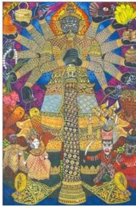
ภาพ โปสเตอร์ที่มีส่วนประกอบของทัศนธาตุในรูปแบบต่างๆ

เส้น เป็นเส้นที่ปรากฏอยู่ในภาพประกอบ หากภาพต้องการแสดงรายละเอียด หรือจุดเน้นที่ชัดเจน เช่น ลักษณะที่แตกแหว่งของพื้นดิน ก็สามารถใช้เส้นเป็นส่วนประกอบสำคัญได้