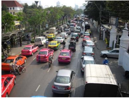
ภาพแสดงสภาพแวดล้อมในเมืองหลวง ที่เต็มไปด้วยดีกรีกรามบ้านช่องที่แออัด และการจราจรติดขัด คิววินพิษจากยานยนต์ ส่งผลให้เกิดมลภาวะทางอากาศ

โดยเฉพาะอย่างยิ่งอัตราการสูบบุหรี่ของเยาวชนชายและหญิง ที่ทวีจำนวนเพิ่มขึ้นอย่างน่าตกใจ