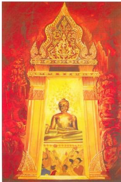
ภาพโปสเตอร์ที่มีการจัดองค์ประกอบศิลป์อย่างงดงามและครบถ้วน ทั้งเอกภาพ ความสมดุลและจุดเด่น