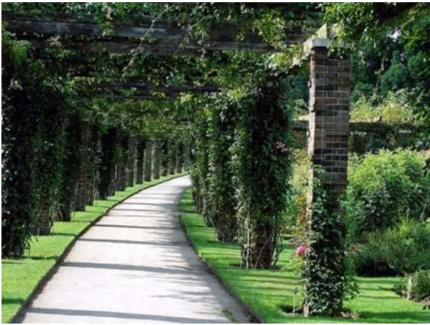
1/30 ภาพสวนสาธารณะ มีการออกกำลังกาย สวนสาธารณะเป็นสถานที่พักผ่อน และออกกำลังกายที่ผู้คนในสังคมเมืองพากันไปหา

นอกจากนี้สิ่งแวดล้อมยังมีส่วนเกี่ยวข้องกับชีวิตมนุษย์โดยไม่จบสิ้น ทรัพยากรธรรมชาติได้ให้ปัจจัย 4 ประการ ได้แก่ อาหาร เครื่องนุ่งห่ม ที่อยู่อาศัย และยารักษาโรค สิ่งแวดล้อมที่ดียังช่วยให้อากาศที่บริสุทธิ์แก่เรา เป็นสถานที่พักผ่อนหย่อนใจ และที่ออกกำลังกาย ช่วยให้คนเรามีความสุขสมบูรณ์ทั้งทางร่างกายและทางจิตใจ ซึ่งจะส่งผลไปถึงพัฒนาการด้านสติปัญญาของเด็กอีกด้วย