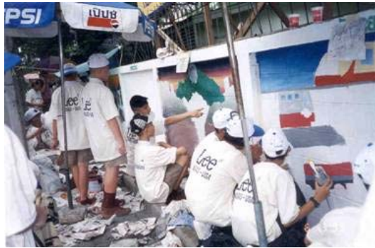
การร่างภาพบนผนังกำแพง โดยใช้ดินสอแกนแข็ง หรือสีร่างภาพตามความถนัดและความเหมาะสม

นักเรียนแต่ละกลุ่ม มอบหมายให้นักเรียนที่มีความถนัดในการวาดเส้นและร่างภาพ ช่วยกันร่างภาพด้วยดินสอหรือใช้สีตามความถนัด โดยคำนึงถึงหลักองค์ประกอบศิลป์