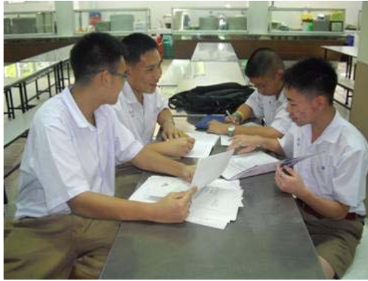
การประชุมระดมความคิด การวิเคราะห์หัวข้อเรื่อง และกำหนดโครงเรื่องและวางแผนการทำงาน

นักเรียนแต่ละกลุ่มร่วมกันวิเคราะห์หัวข้อเรื่องที่จะวาด และศึกษาค้นคว้ารวบรวมข้อมูลเกี่ยวกับปัญหาของสิ่งแวดล้อม และภาพประกอบในการวาดภาพ นำมากำหนดโครงเรื่อง วางแผนการทำงานและแบ่งหน้าที่การปฏิบัติงานให้เหมาะสมและทั่วถึง พร้อมทั้งหาสีขารองพื้นบนผนังกำแพงก่อนที่จะร่างภาพ