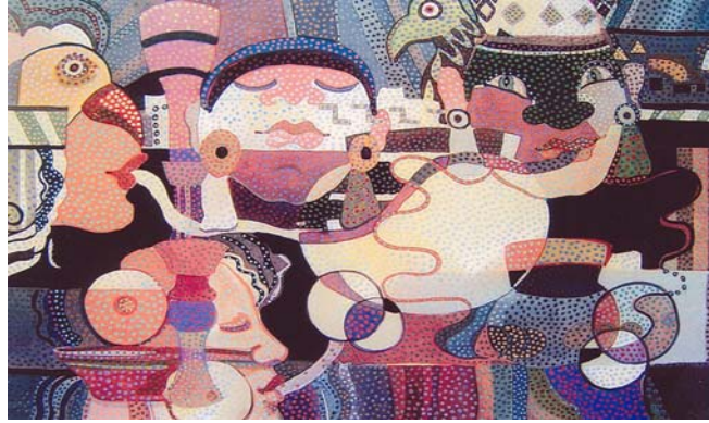
ความกลมกลืนจากสิ่งที่คล้ายกัน

รูปร่าง รูปทรง หรือสิ่งที่มีลักษณะใกล้เคียงกัน เช่น การใช้รูปทรงกลมและวงรีมาจัดเข้ากลุ่มกัน จะเกิดความกลมกลืนกันได้ เป็นต้น