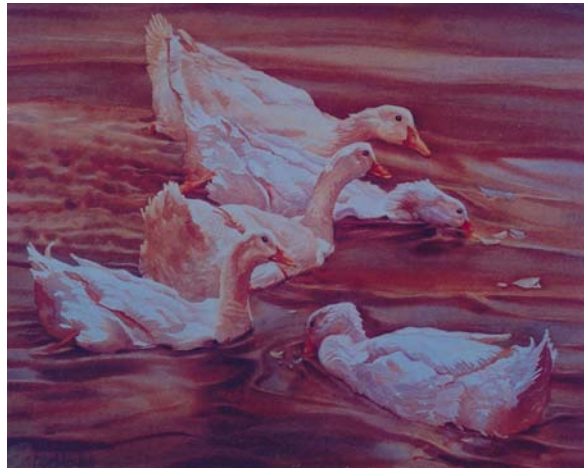
ความสัมพันธ์กัน สอดคล้องกัน

เราจะออกแบบงานทัศนศิลป์ให้มีความสัมพันธ์กลมกลืนได้อย่างไร