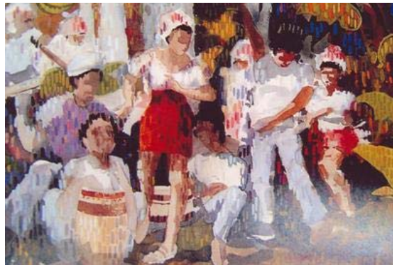
ความกลมกลืนด้วยลักษณะผิว