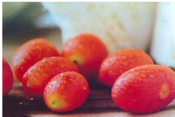
ความกลมกลืนด้วยสี

การเลือกใช้สีในวรรณคดีเดียวกัน จะทำให้สีกลมกลืนกันได้