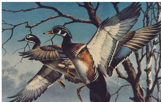
ความกลมกลืนจากสิ่งที่เหมือนกัน

ความกลมกลืนในการจัดองค์ประกอบศิลป์ด้วยรูปร่างหรือรูปทรงที่เหมือนกันมีลักษณะซ้ำๆ กัน