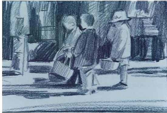
ความกลมกลืนด้วยเส้น

การใช้เส้นในลักษณะเดียวกัน หรือในทิศทางเดียวกันมาจัดรวมกัน จะทำให้เกิดความกลมกลืนกันได้