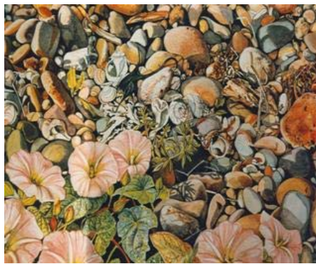
ความสมดุลทั้งสองข้าง มีรูปทรงสัดส่วนไม่เหมือนกัน แต่เมื่อดูภาพโดยรวมแล้วมีความสมดุล

4.2 ความสมดุลหรือคล้ายภาพที่ไม่เหมือนกันทั้งสองข้าง คือความสมดุลที่มีซีกซ้ายและซีกขวาไม่เหมือนกันหรือไม่เท่ากัน แต่เท่ากันด้วยความรู้สึกเพื่อต้องการให้ภาพมีความเคลื่อนไหวแปลกตา และไม่น่าเบื่อหน่าย นิยมใช้ในงานที่ต้องการดึงดูดความสนใจ มีอิสระในการออกแบบ