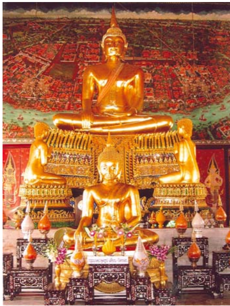
คล้ายภาพที่เหมือนทั้งสองข้าง เป็นภาพที่ทำให้ความรู้สึกสงบนิ่ง และมีสมาธิ

4.2 ความสมดุลหรือคล้ายภาพที่ไม่เหมือนกันทั้งสองข้าง คือความสมดุลที่มีซีกซ้ายและซีกขวาไม่เหมือนกันหรือไม่เท่ากัน แต่เท่ากันด้วยความรู้สึกเพื่อต้องการให้ภาพมีความเคลื่อนไหวแปลกตา และไม่น่าเบื่อหน่าย นิยมใช้ในงานที่ต้องการดึงดูดความสนใจ มีอิสระในการออกแบบ