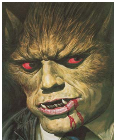
งานออกแบบทัศนศิลป์ที่แสดงจุดเด่นด้วยลักษณะผิว

เป็นการกำหนดลักษณะผิวหรือพื้นผิวภายนอกสุดของจุดเด่น หรือส่วนสำคัญของภาพ เป็นลักษณะผิวที่แปลกแตกต่างไปจากส่วนประกอบอื่นๆ ทำให้เกิดความรู้สึกน่าสนใจ