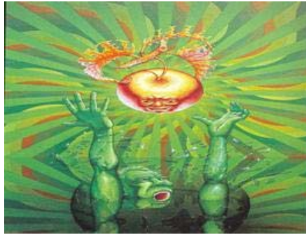
งานออกแบบทัศนศิลป์ที่แสดงจุดเด่นด้วยสีที่สะดุดตา

เป็นการกำหนดสีของจุดเด่นหรือส่วนสำคัญของภาพให้โดดเด่น และแตกต่างไปจากส่วนอื่นๆ เช่น การใช้สีแดงซึ่งมีวรรณะร้อนเป็นจุดเด่น ท่ามกลางสีวรรณะเย็น การใช้สีอ่อนหรือสีสว่างท่ามกลางสีเข้มหรือสีดำ เป็นต้น