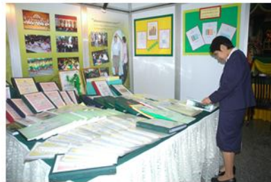
การจัดนิทรรศการเป็นการเผยแพร่ข่าวสาร การประชาสัมพันธ์ การให้การศึกษา แก่ผู้ชมหรือผู้ที่เข้าร่วมกิจกรรมได้คุณค่าสาระแห่งความรู้ และการแลกเปลี่ยนประสบการณ์