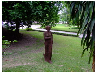
นิทรรศการภายนอกหรือกลางแจ้ง

4.2 นิทรรศการภายในหรือในร่ม การจัดนิทรรศการภายใน เป็นการจัดขึ้นภายในอาคารที่เป็นห้อง ๆ หรือสถานที่ที่จัดเตรียมไว้สำหรับการแสดงผลงานโดยเฉพาะ ซึ่งสะดวกทั้งในการจัดและการดูแลรักษา สามารถจัดได้ทุกฤดูกาล ถ้าไม่มีสถานที่เฉพาะอาจจะใช้สถานที่อื่น ที่มีพื้นที่มากพอที่จะตัดแปลงใช้จัดนิทรรศการเป็นครั้งคราวก็ได้