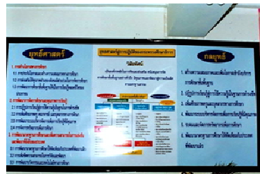
นิทรรศการภายใน เป็นการจัดขึ้นภายในอาคารที่เป็นห้อง ๆ

4.3 นิทรรศการลอยฟ้า เป็นการจัดกลางอากาศ เป็นการแสดงสิ่งประดิษฐ์ เพื่อการค้าหรือประกอบการพาณิชย์ เช่น นิทรรศการบอลูนนานาชาติ การแสดงบอลูนแบบแปลกๆ เป็นต้น ดังนั้นการเลือกสถานที่จัดนิทรรศการจะเป็นภายนอกหรือภายในนั้น ควรคำนึงถึงความเหมาะสมด้านต่าง ๆ เช่น มีบริเวณกว้างขวางพอ มีแสงสว่างส่องได้ทั่วถึง มีทางเข้าออกสะดวก มีอุณหภูมิพอเหมาะไม่ร้อนหรือเย็นเกินไป มีความสงบปราศจากเสียงรบกวน เป็นต้น