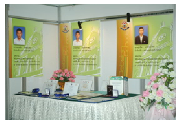
ประเภทของการจัดนิทรรศการ จัดเกี่ยวกับการศึกษา การตลาด การเมือง ศิลปะวัฒนธรรม และสิ่งแวดล้อม การทหาร และการประชาสัมพันธ์องค์กร