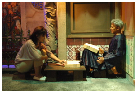
พิพิธภัณฑ์หุ่นขี้ผึ้งของสิงคโปร์ เป็นนิทรรศการถาวร กระตุ้นและชักจูงความคิดของผู้ชมในเรื่องที่ต้องการสร้างสำนึกทางการเมืองของประเทศไทย