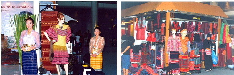
การแสดงนิทรรศการชั่วคราว งานสัปดาห์เครื่องแต่งกายไทย เป็นการจัดนิทรรศการในวาระโอกาสเทศกาลพิเศษเพื่อแสดงสินค้าเกี่ยวกับผ้าไทย

6) เพื่อให้ความรู้เฉพาะเรื่องแก่ผู้ชม เช่น นิทรรศการ เรื่องโรคเอดส์ นิทรรศการเรื่องพิษภัยของบุหรี่ เป็นต้น