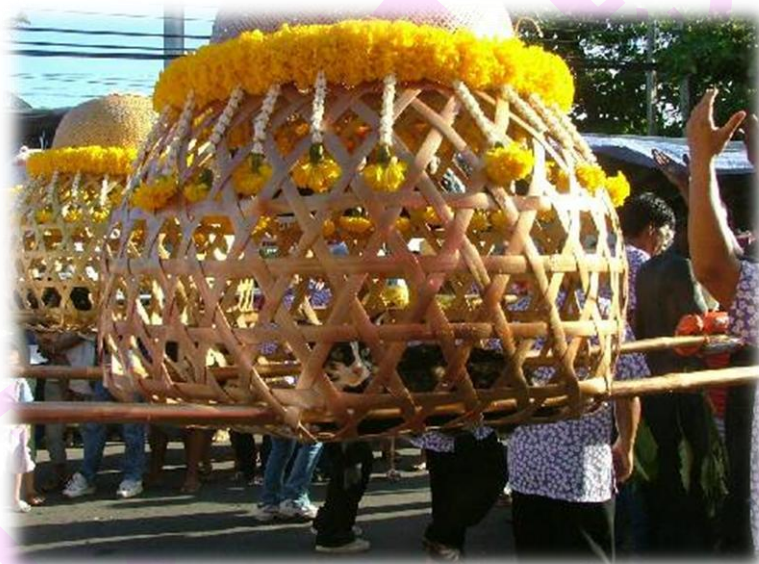
Figure 2 พิธีแห่นางแมวของฝน