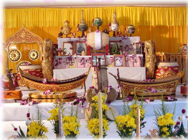
Figure 3 ประเพณีไหว้ครูดนตรีไทย