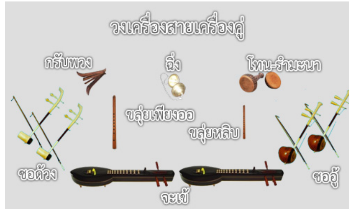
วงมโหรีเครื่องคู่