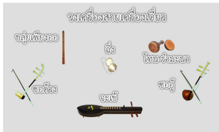
วงเครื่องสายเครื่องเดียว