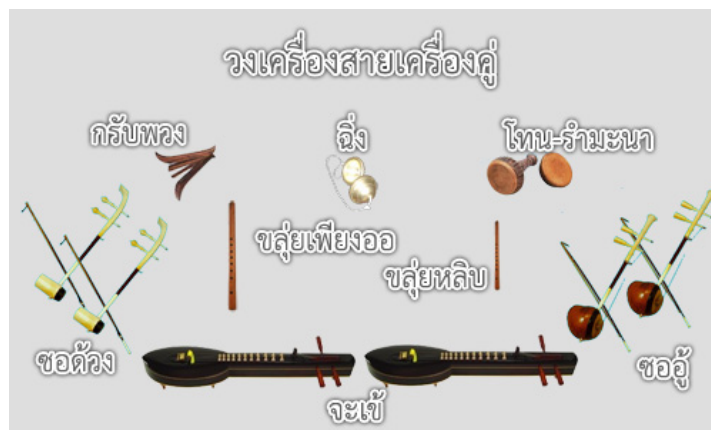
วงเครื่องสายเครื่องคู่