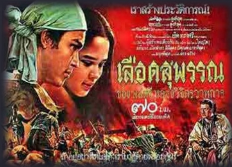
ละคร เรื่องเลือดสุพรรณ

ลักษณะการแสดงเป็นละครเวที มีการทำเพลงไทยเดิม มาใส่บทร้อง สมัยใหม่ เป็นลักษณะเพลงไทยสากล แต่ยังใช้เรียกชื่อว่าละครร้อง เรื่องที่มีชื่อเสียง คือเรื่องจันทร์เจ้าชา