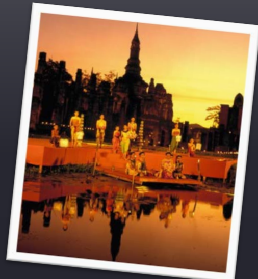
ภาพจำลองบรรยากาศ สมัยสุโขทัย

ในสมัยสุโขทัยนี้ ไทยได้รับวัฒนธรรมของอินเดียเข้ามา พร้อมกับเรื่องของศาสนาพุทธ และ ฮินดู ด้านการแสดงได้รับการ พัฒนารำ และ ระบำ ตามแบบอย่างของอินเดีย มีการบัญญัติ คำโขน ละคร ฟ้อนรำ