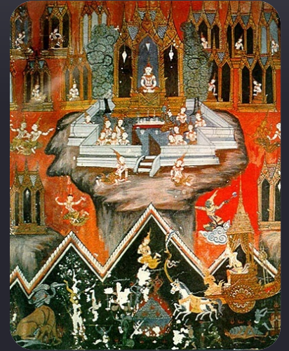
จิตรกรรมฝาผนัง วัดนายโรง

ทรงให้ยกเลิกละครหลวง จึงทำให้การละครไทยแพร่หลายในหมู่ประชาชนมากขึ้น มีการละครของเจ้าขุนมูลนาย หัดละคร แสดงเป็นอาชีพจนมีรายได้จากการแสดงมากมาย เช่น ละครพระองค์เจ้าลักขณานุคุณ ละครเจ้ากรับ จะเห็นได้ว่าการแสดงละครทำให้เจ้าของคณะละครมีฐานะร่ำรวย จึงเกิดศรัทธาในการสร้างวัด ที่มีชื่อเสียงกับการละคร เช่น วัดละครทำวัดนายโรง (มีหลักฐานที่วัดนายโรงริมคลองบางกอกน้อยว่าท่านเจ้ากรับเจ้าของคณะละครนอกเป็นผู้สร้างในสมัยรัชกาลที่3)