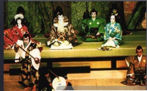
ละครคาบูกิ

3.นาฏศิลป์ญี่ปุ่น ญี่ปุ่นเป็นประเทศที่ได้รับการรุกรามทางวัฒนธรรมจากจีนจักรพรรดิญี่ปุ่นจึงมีนโยบายที่จะปลูกฝังให้ประชาชนรักชาติและเห็นคุณค่าของศิลปวัฒนธรรมประจำชาติ นาฏศิลป์ญี่ปุ่นในสมัยโบราณมาจากความเชื่อทางศาสนาและสิ่งศักดิ์สิทธิ์การแสดงออกมาจากวัดและขยายตัวเข้าไปสู่ราชสำนัก นาฏศิลป์ญี่ปุ่นได้แก่ ละครคาบูกิ โปะะ และเตียวเง็น