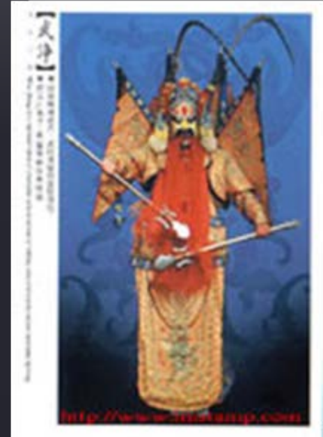
ตัวละครในอุปรากรจีน