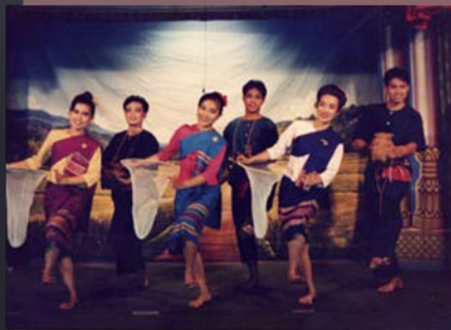
เซิ้งสวิง