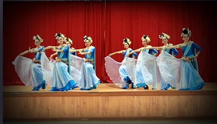
การแสดงระบำพื้นเมือง

เป็นการเต้นรำประจำท้องถิ่นหรือของประเทศ แสดงออกด้วยความสนุกสนานระหว่างการทำมาหากิน หรือในพิธีตามโอกาสต่าง ๆ แสดงให้เห็นถึงสภาพวิถีชีวิต วัฒนธรรม ประเพณี เช่น ระบำสเปน ระบำสก๊อต การรำดาบ การเต้นของอินเดียนแดง ฯลฯ