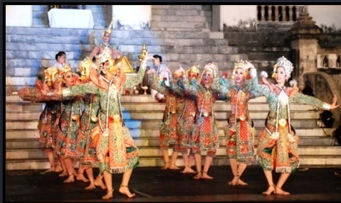
ละครตีกดาบรพร