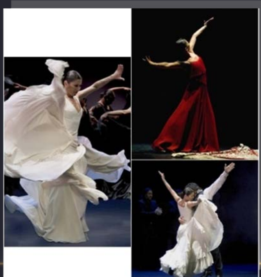
การแสดงบัลเลต์

4.บัลเลต์ คือการเต้นระบำปลายเท้า ที่เน้นการใช้ความสามารถของเท้า เป็นหลักประกอบกับการใช้ลีลาของมือและแขน กำเนิดขึ้นใน ค.ศ.ที่ 15 ในราชสำนักฝรั่งเศส