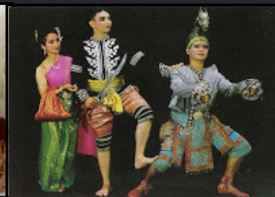
ละครเสภา