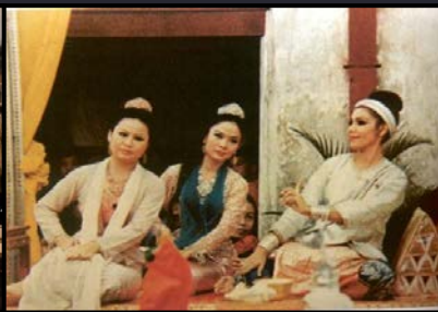
ละครพันทาง