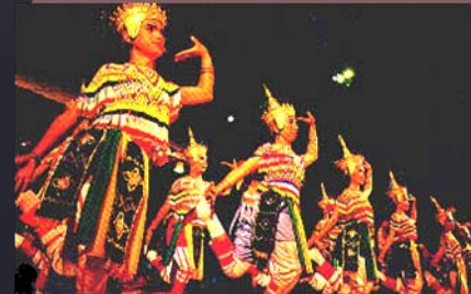
ฟ้อนเล็บ