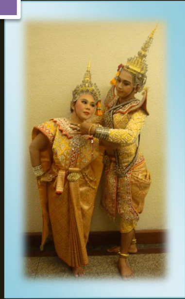
การแต่งกายยืนเครื่องพระนาง

การแสดงนาฏศิลป์ไทยมีรูปแบบของการแสดง หลายประเภท ฉะนั้นการแสดงแต่ละประเภทต้องมี เครื่องแต่งกายที่เหมาะสม สวยงามตามหลักการ สร้างสรรค์ เช่น การแสดงโขน การแต่งกายพระรามต้อง แต่งกายยืนเครื่องพระสีของเสื่อต้องสีเขียว พระลักษมณ์ ต้องใช้เสื่อสีเหลือง หนุมานลิงขาว สีเสื่อใช้สีขาว การแสดงพื้นเมืองภาคเหนือต้องใส่ผ้าซิ่นกรอมเท้า เกล้าผมมวยสูง การแสดงพื้นเมืองของภาคกลางรำ กลองยาว ผู้หญิงใส่เสื่อแขนกระบอก ห่มสไบ เป็นต้น