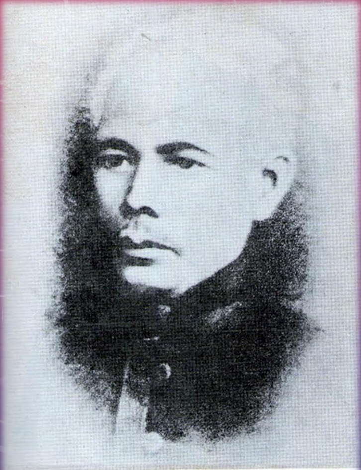
พระยาศรีสุนทรโวหาร (น้อย อาจารยางกูร)